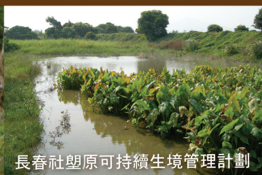
長春社壆原可持續生境管理計劃

長春社是一非牟利團體，他們會協助在壆原濕地的農友在農墟出售其種植的水菜類； 農場精選：西洋菜、通菜 農墟擺賣自2006年9月